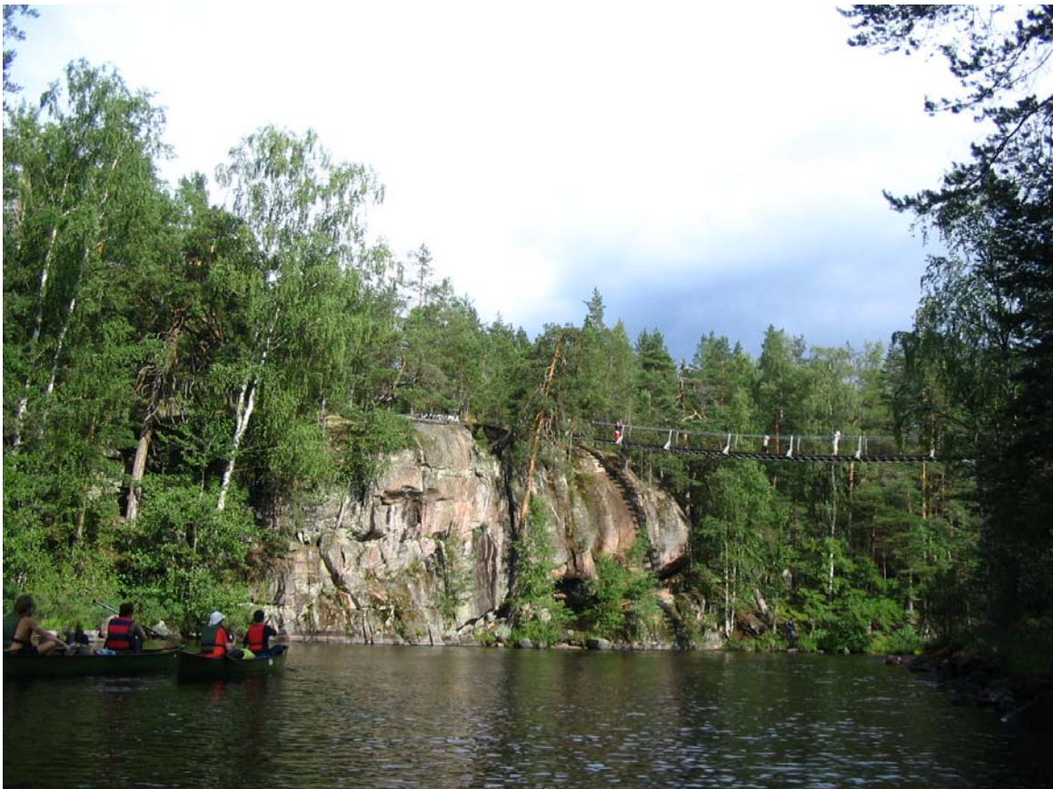
Retkeläiset melovat jylhässä maisemassa riippusillan luona.

Seuraavana kohteena matkallamme oli tuhansia vuosia vanhojen kalliomaalausten bongaminen kallionseinästä veneidemme yläpuolella, mihin kulutimmekin muutaman minuutin kunnes eriävien havaintojen ja arvuuttelujen jälkeen jatkoimme melontaa lahdenpohjukkaan, jonne ehdimme juuri ennen sadetta. Sadetta pidimmekin pari tuntia mukavasti makkaroita paistellen, ja suuntasimme vielä viimeiselle lyhyelle etapille kuuluisan Lapinniemen riippusillan alle ennen paluuta.