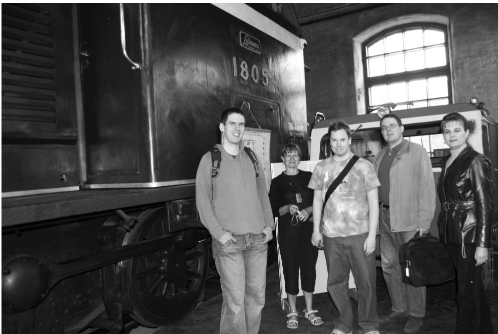
Keriläisiä vierailulla veturimuseossa.